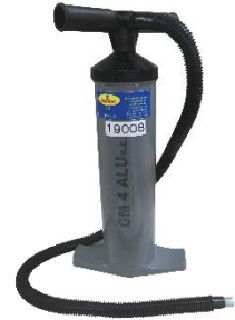
※フィットポンプは別売りとなります